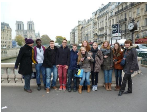
Auf der Rückfahrt haben wir einen Zwischenstopp in Paris gemacht.