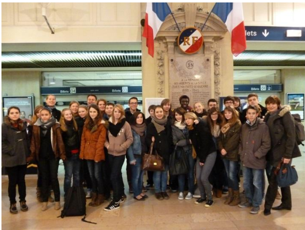
Good-bye! Au-revoir! Auf Wiedersehen in Alkmaar!