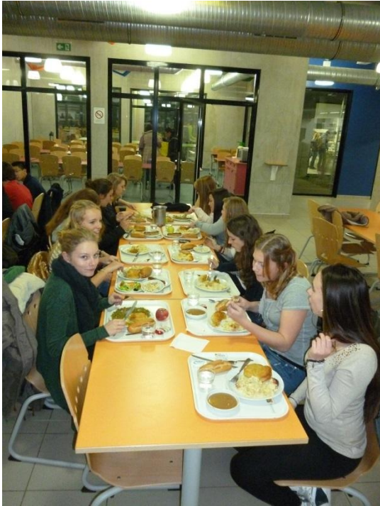
In der Schulmensa haben wir zusammen zu Abend gegessen.