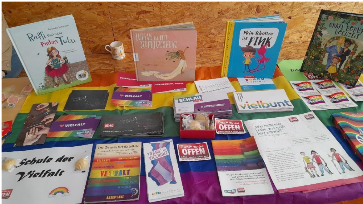
Workshop und Projektergebnisse